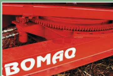
Giro Hidráulico do cavalete e carretel.

Acionamento do redutor através da turbina hidráulica ou motor diesel, para altas velocidades de enrolamento da mangueira.