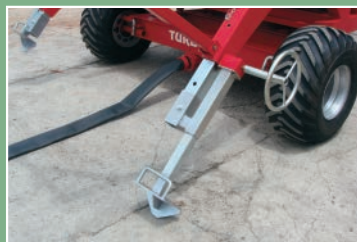
Redutor mecânico para levante das âncoras e sistema de entrada de água pelo chassi.