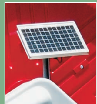
Placa Solar para recarga de bateria.