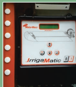
Painel eletrônico de controle de velocidade.