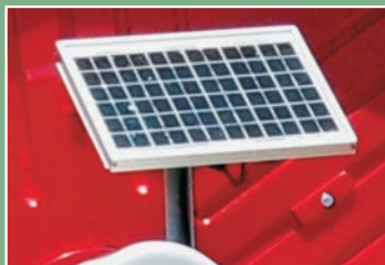
Placa Solar para recarga de bateria.