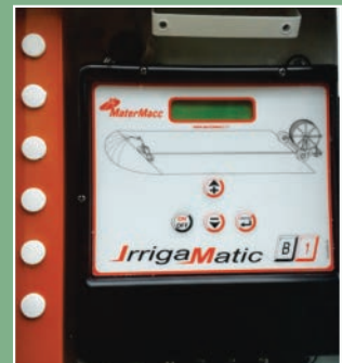
Painel eletrônico de controle de velocidade.