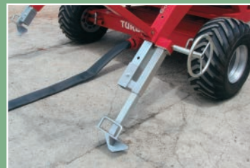
Redutor mecânico para levante das âncoras e sistema de entrada de água pelo chassi (opcional).