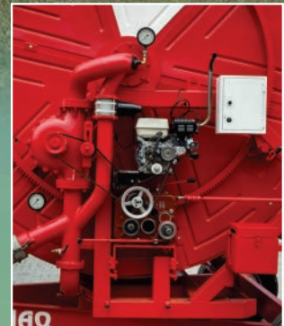
Acionamento do redutor através da turbina hidráulica ou motor diesel, para altas velocidades de enrolamento da mangueira.