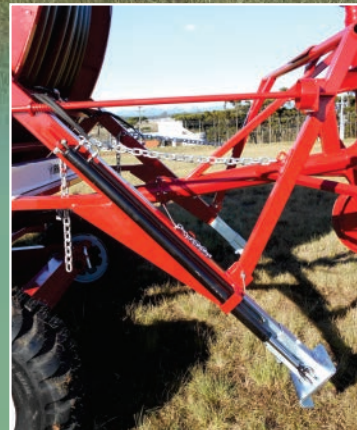
Levante hidráulico das sapatas de apoio.