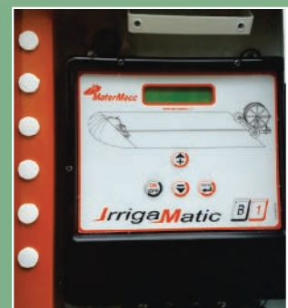
Painel eletrônico de controle de velocidade