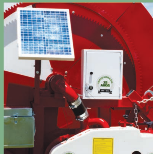
Painel solar para recarga de bateria