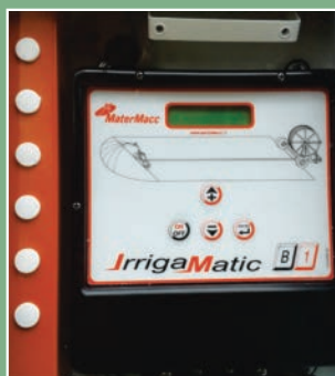
Painel eletrônico de controle de velocidade